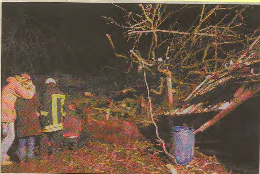
Drama am Dönberg: Dort ließ der Orkan einen Baum auf eine Stallung fallen (Foto links). Umgeknickte Bäume sorgten auch auf dem Vorwerk-Gelände in Laaken (rechts)