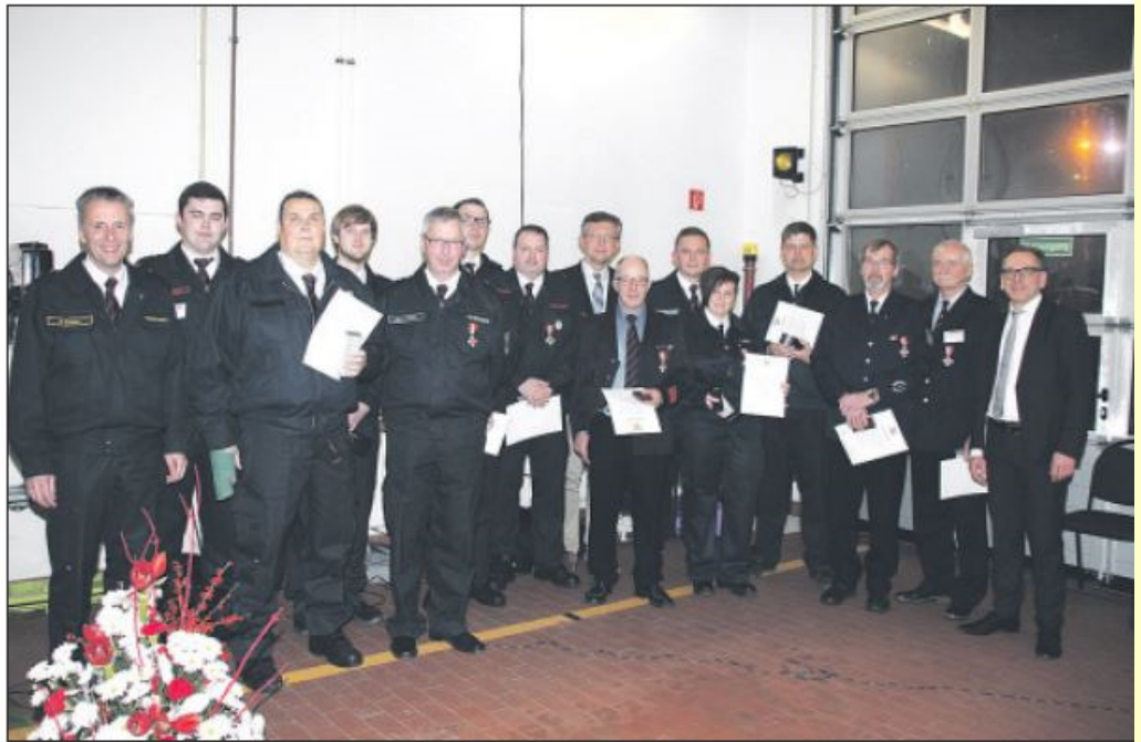
Alle Ausgezeichneten der FF Wuppertal, die seit 25 beziehungsweise 35 Jahren im Einsatz sind.